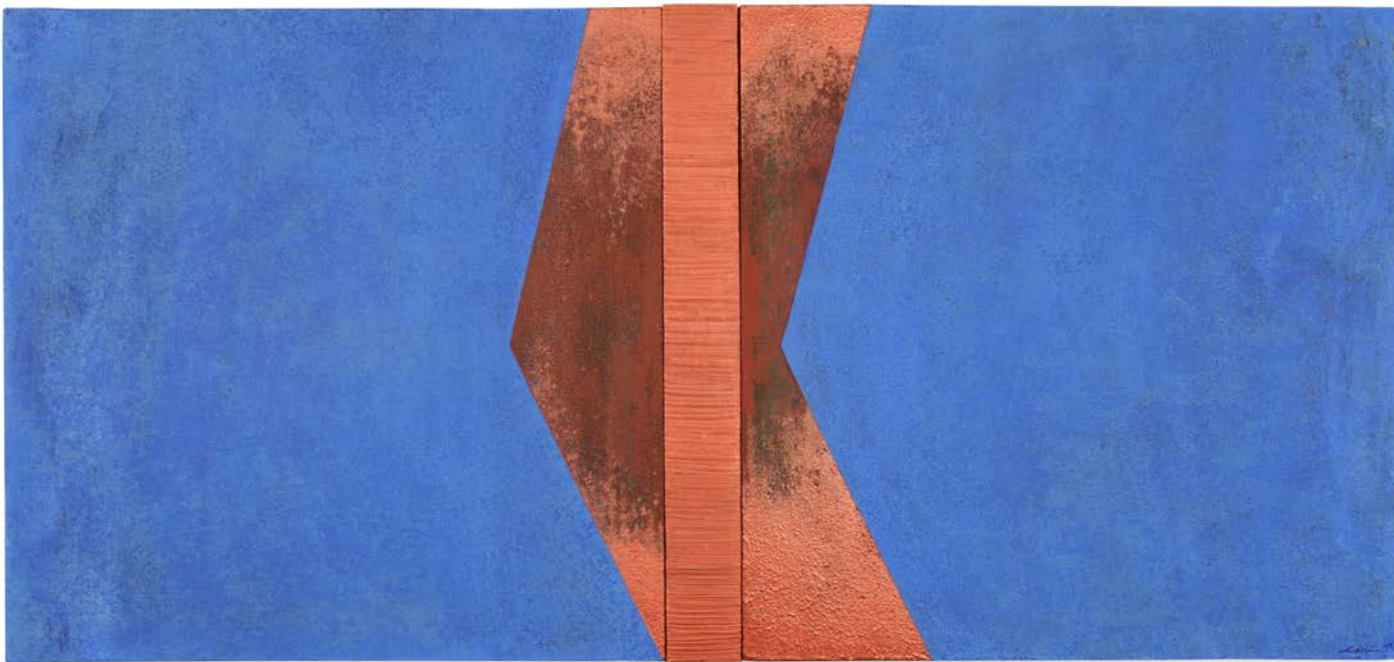
A través del azul VI, 2024. Acrílico sobre tela y sobre madera. 41 x 87 x 4,5 cm.