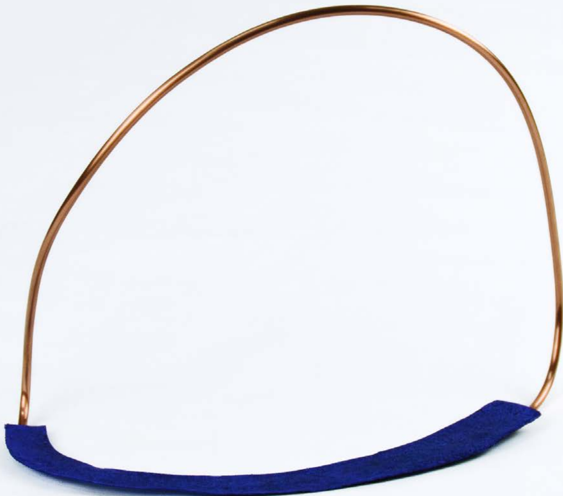
Copper Loop VIII, 2024. Acrílico sobre tela y tubo de cobre. 29,5 x 40,5 x 16 cm.