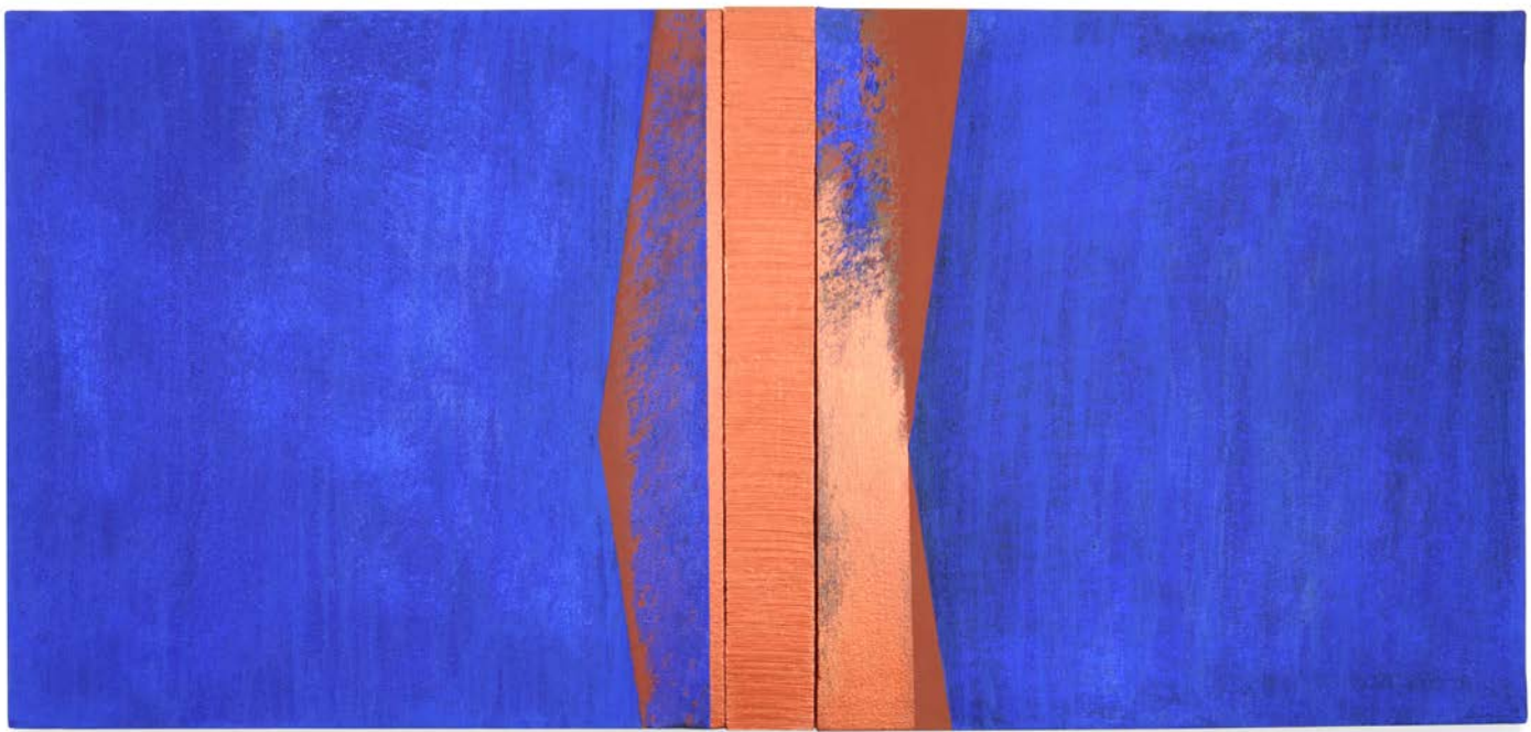
A través del azul III, 2024. Acrílico sobre tela y sobre madera. 41 x 87,5 x 4 cm.