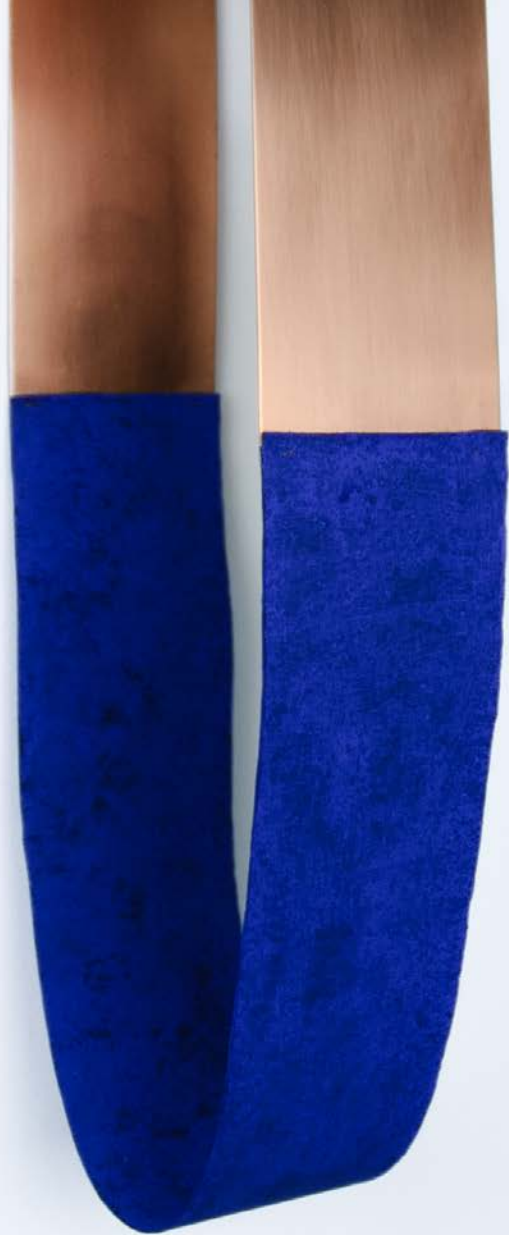
Loop II, 2024. Detalle.