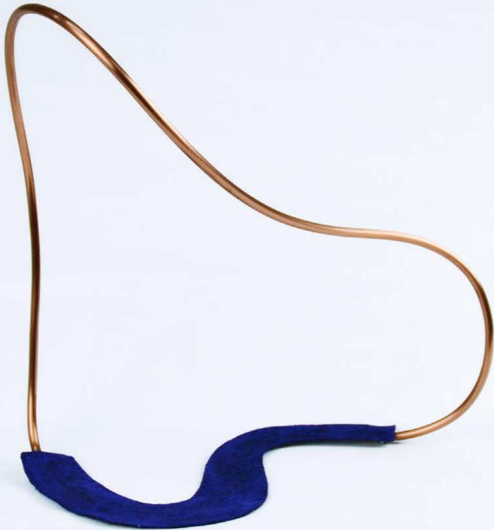
Copper Loop VI, 2024. Acrílico sobre tela y tubo de cobre. 31 x 33 x 17,5 cm.