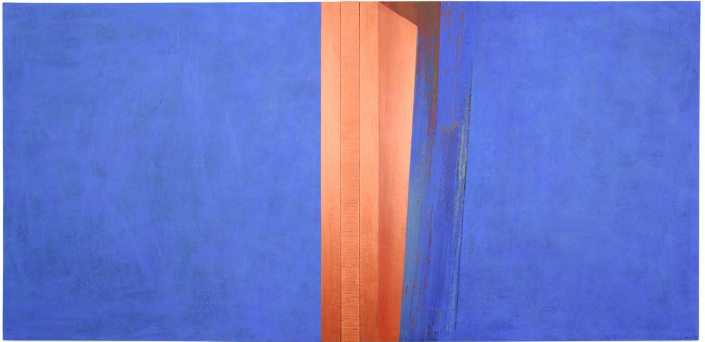
A través del azul I, 2024. Acrílico sobre tela y sobre madera. 85 x 175 x 4,5 cm.